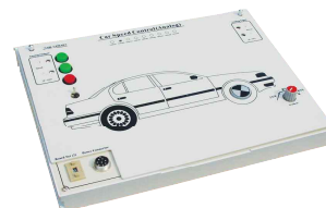
| Analogue I/O 2input / 2output |